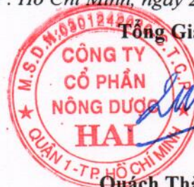
Quách Thành Đồng